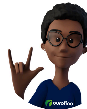
Incluir para juntos reimaginar (A Maya leva acessibilidade para os usuários dos nossos sites)