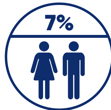
Equidade salarial (Diferença salarial explicável: desempenha funções diversas e níveis diferentes de experiências.)