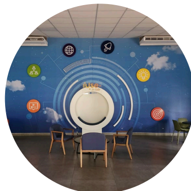
iUse In Lab (Desenvolvimento profissional)