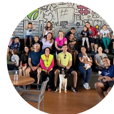
Dia da Família